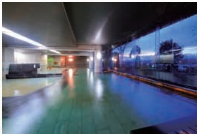
開放的な大浴場で心身のリラクゼーションをご満喫ください。