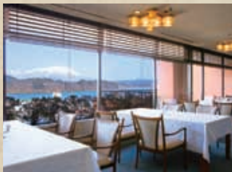
レストラン・あすか

湯守ホテル大観の楽しみは、季節感豊かなお料理と地酒。優雅に食事を楽しめる和食処やレストラン、落ち着いた時間を過ごせるお洒落なラウンジ。グルメを満喫するひとときが、旅の贅沢な余韻になります。