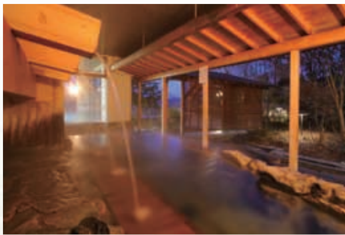
打たせ湯露天では良質な温泉を浴びながら四季折々の風景をお楽しみください。