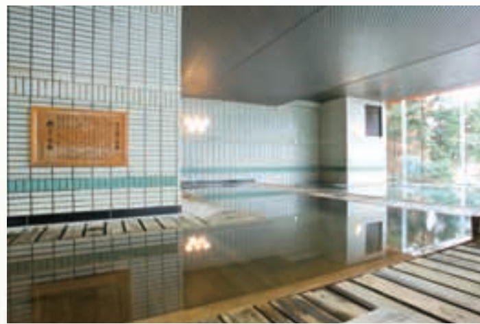
木の香り漂う、当代随一の広さを誇る大檜風呂で体の芯までリラックスできます。